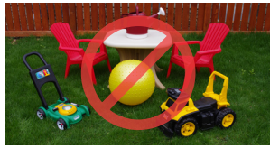
ລາຍການພາດສະຕິກຂະໜາດໃຫຍ່ ແລະ ເຄື່ອງຫຼິ້ນ