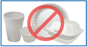
ໂຟມພາດສະຕິກ (Styrofoam™)