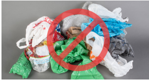
ຖົງພາດສະຕິກ ແລະ ຍາງໃສ່

ສົນຄຳຕໍ່ໂບນູເຮັດໃຫ້ເກີດບັນຫາໃນຂະບວນການລົ້ມໄຊເຄິນ ເນື່ອງຈາກພວກມັນຕົດຢູ່ໃນອຸປະກອນ, ສາມາດເປັນອັນຕະລາຍຕໍ່ຄົນງານ ແລະ ບໍ່ມີຕະຫຼາດທີ່ຈະເຮັດໃຫ້ພວກມັນກາຍເປັນວັດສະດຸໃໝ່. ຮັກສາພວກມັນໃຫ້ຫ່າງຈາກການລົ້ມໄຊເຄິນຂອງທ່ານ. ສຶກສາເພີ່ມເຕີມທີ່ hennepin.us/recycling