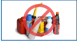
ຕູ້ບັນຈຸທິບັນຈຸຜະລິດຕະພັນອັນຕະລາຍ

ຊອກຫາທາງເລືອກໃນການກຳຈັດລາຍການເຫຼົ່ານີ້ ແລະ ອີກຫຼາຍໆຢ່າງໃນຄຸ້ມກິນກຳຈັດສີຂຽວທີ່ hennepin.us/green-disposal-guide