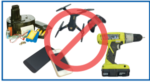
ອຸປະກອນເອເລັກໂຕຣນິກ ແລະ ແບັດເຕີລີ