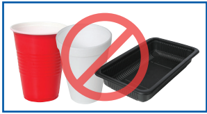
#6 ແລະ ພາດສະຕິກສີດຳ