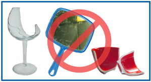
ຖ້ວຍແກ້ວ, ແວ່ນປ່ອງຢ້ຽມ ແລະ ເຄື່ອງບິນດິນເຜົາ