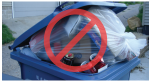
ການລົ້ມໄຊເຄິນແບບກະເປົ່າ