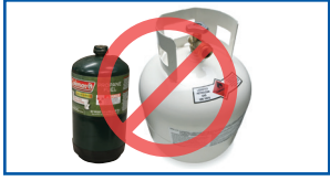
ກະບອກສູບຄວາມກົດດັນ (ຖົງອາຍກຳິດ, ເຮລຽມ, ອາຍກາກໂບນິກ)