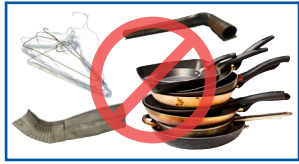
ລາຍການໄລຫະແບບສຸ່ມ