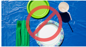
ຈານເຈ້ຍ, ຈອກ, ຜ້າເຊັດປາກ, ທໍ່ດູດ ແລະ ເຄື່ອງໃຊ້ຕ່າງໆ